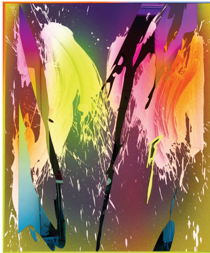
NEMES MÁRTON: NOTHING WITHOUT 23, 2021 PVD-bevonatú rozsdamentes acél, akril, vászon, fa 120 x 100 cm

Szkenneld be, és adományozz közvetlenül!