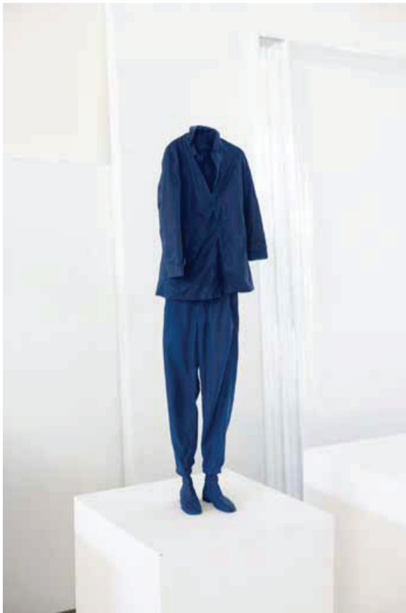
ERWIN WURM: GHOST (SMALL), 2022 aluminium, festék 100 x 28 x 16 cm