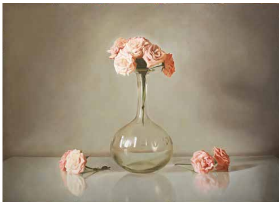
KINGA HAJDÚ Four roses in a symmetrical arrangement, 1998 oil on canvas | 130 x 180 cm Somló-Spengler collection