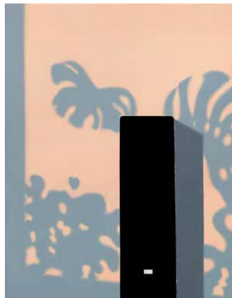
WILHELM SASNAL Untitled (Monstera), 2018 oil on canvas | 180 x 140 cm Somló-Spengler collection