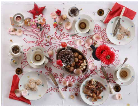
DANIEL SPOERRI Untitled - Faux tableau - piège hongrois (Red table), 2007 assemblage | 120 x 120 x 40 cm Somló-Spengler collection

The seventh art exhibition of the AQVA Art Collection, titled Make yourself at home! , explores the relationship and intertwining of the space closest to us, our home, with gastronomy through contemporary artistic approaches. The notion of home is expanded from a mere location to an abstract notion of a place evoked by food and taste.