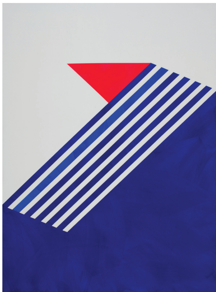
NÁDLER ISTVÁN: MAJD, 2018 akril, vászon 190 x 140 cm