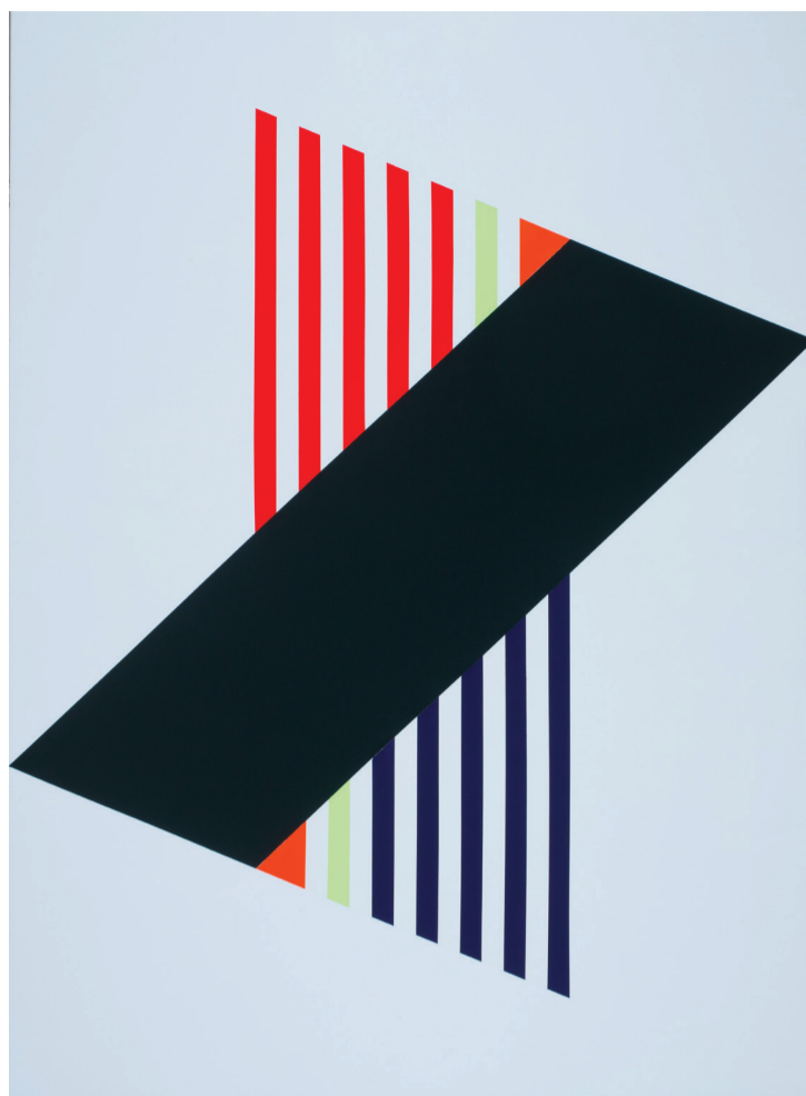
NÁDLER ISTVÁN: EZT MAJD RÖVID CSEND KÖVETI, 2018 akril, vászon 190 x 140 cm